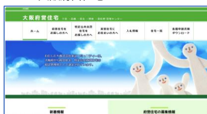
<大阪府営住宅トップページ>