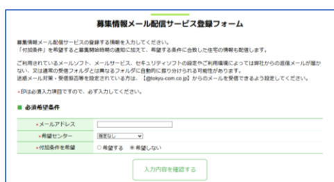
<登録フォーム画面>