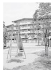
児童遊園（住宅敷地内）