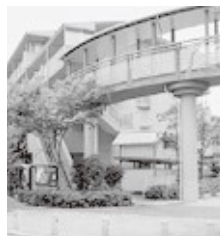
立体遊歩道（住宅敷地内）