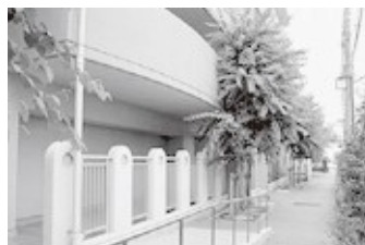
遊歩道（住宅敷地内）