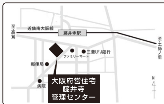
近鉄南大阪線「藤井寺」駅下車徒歩約2分