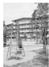
児童遊園（住宅敷地内）