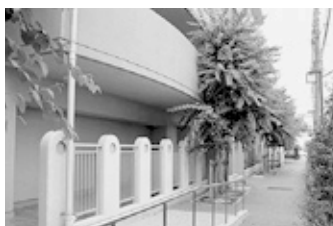
遊歩道（住宅敷地内）