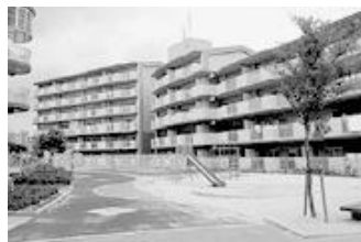
児童遊園（住宅敷地内）