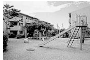
児童遊園（住宅敷地内）