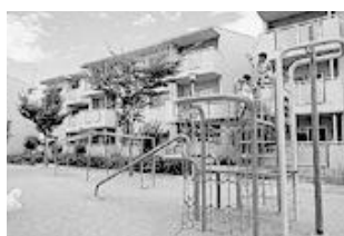
児童遊園（住宅敷地内）