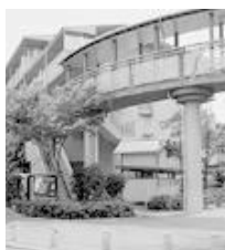
立体歩道道（住宅敷地内）