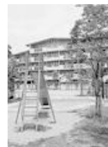
児童遊園（住宅敷地内）