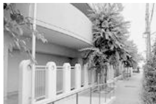
歩道道（住宅敷地内）