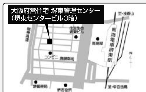
南海高野線「堺東」駅下車徒歩約4分