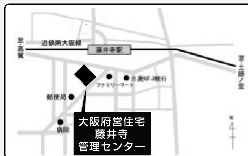
近鉄南大阪線「藤井寺」駅下車徒歩約2分