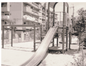
児童遊園（住宅敷地内）