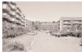
駐車場（住宅敷地内）