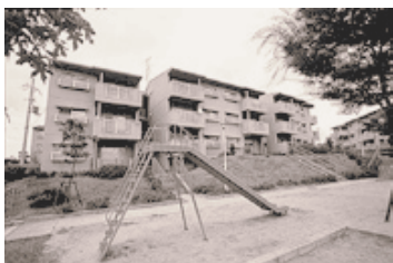
児童遊園（住宅敷地内）