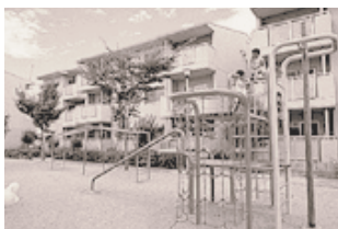
児童遊園（住宅敷地内）