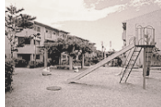
児童遊園（住宅敷地内）