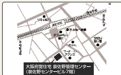
南海本線「泉佐野」駅下車徒歩約3分