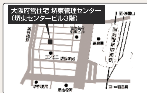
南海高野線「堺東」駅下車徒歩約4分