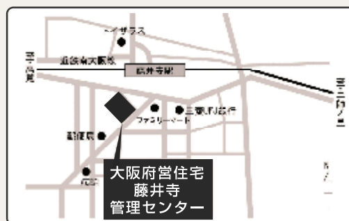
近鉄南大阪線「藤井寺」駅下車徒歩約2分