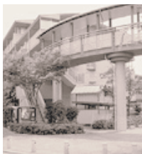
立体遊歩道（住宅敷地内）