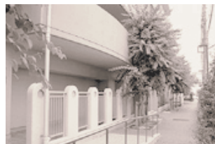
遊歩道（住宅敷地内）