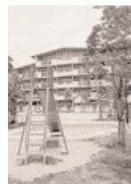
児童遊園（住宅敷地内）